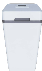
zmiękczacze wody A1000 - 28l złoża