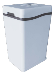
zmiękczacze wody A800 - 23l złoża

Rekomendowana dla stacji zmiękczenia wody A800 i A1000 ze złożem SuperFine